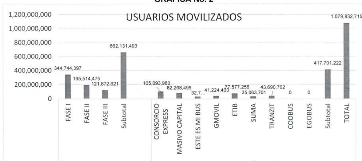
GRAFICA No. 2

Para el mismo periodo los Concesionarios COOBUS y EGOBUS continuaron la cesación de actividades en la prestación del servicio, afectando gravemente todos los componentes que integran el sistema y especialmente el servicio público de transporte que se debía prestar en las zonas concesionadas; tal situación imposibilita la Implementación total del sistema.