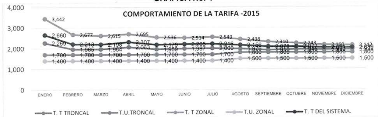
GRAFICA No. 4