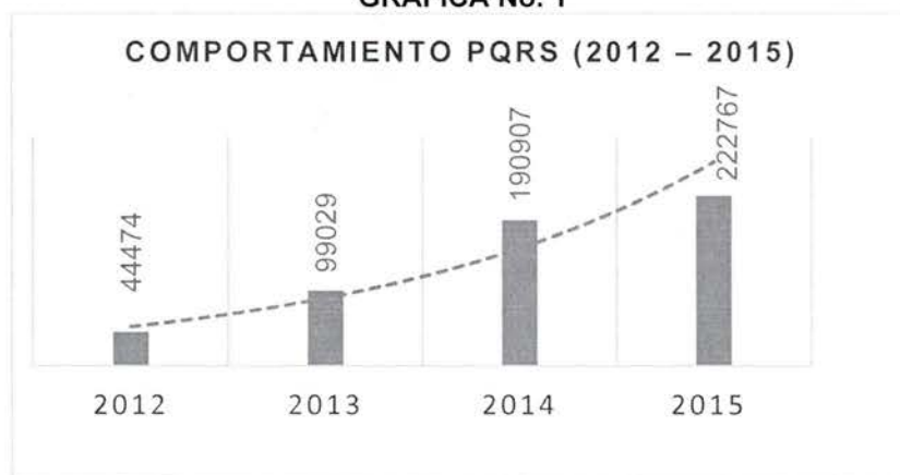
GRAFICA No. 1